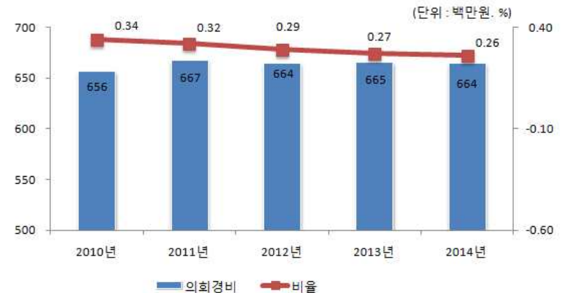
의회경비 연도별 집행액 및 비율 변화