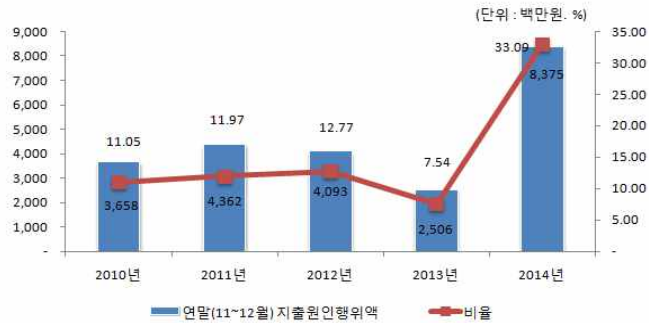
연말지출비율 연도별 변화

☞ 연말지출 비율은 11~12월 지출 원인 행위액을 기준으로 작성한 것으로 전년도에 비해 많이 증가한 사유로는 하반기 집중호우로 인해 피해복구공사에 대한 지급이 많았기 때문입니다.