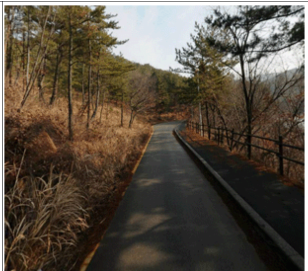
2014년 시행 예정