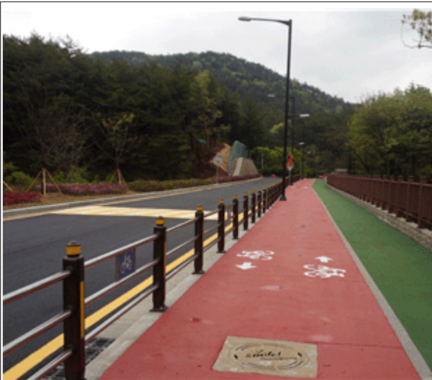
2013년 이전 완료