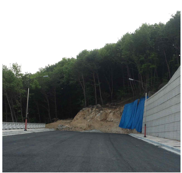
2014년 시행 예정