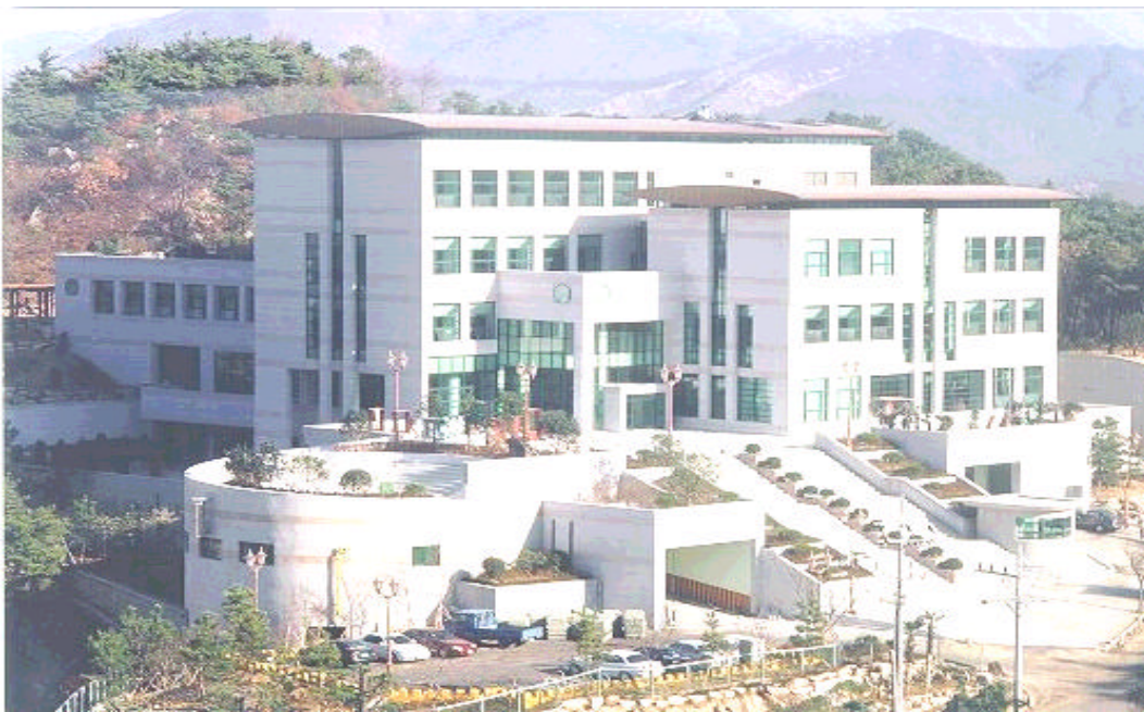
【 圖書館 全景 】