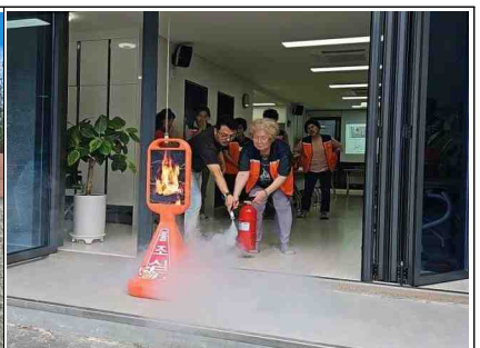
시니어 문화 공작소