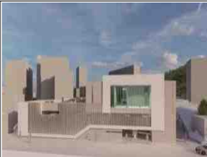
금사푸드&파크 및 공영주차장 조감도