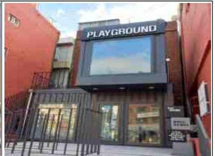
플레이그라운드 조성 완료(서1동)