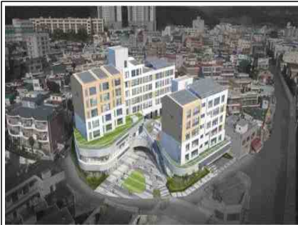
금사 도시재생 어울림센터 조감도