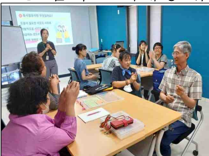
기억채움 동행인 양성과정